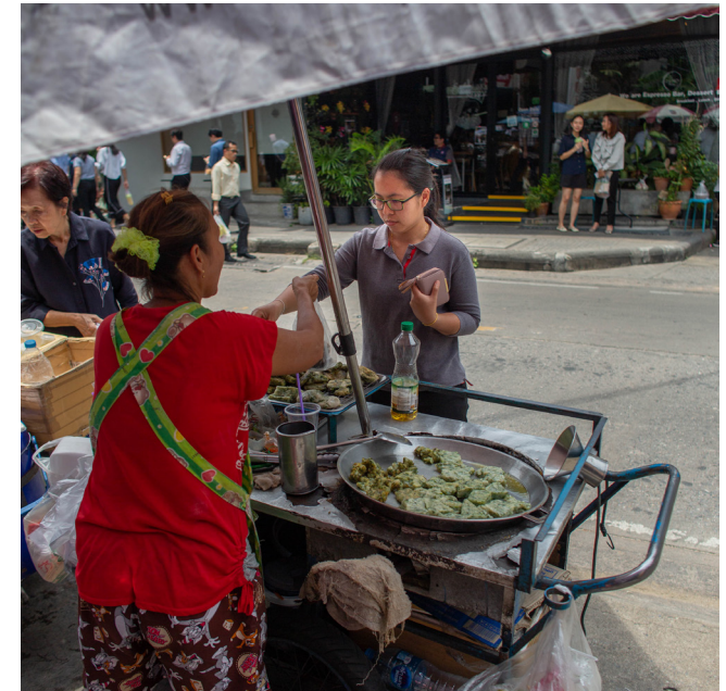
ผู้ค้าหาบเร่แผงลอยในกรุงเทพมหานครกำลังขายของ

ในทุกการแบ่งภาคภูมิศาสตร์ แต่อัตราความเป็นแรงงานนอกระบบของผู้หญิงในอาชีพนี้จะค่อนข้างสูงกว่าผู้ชาย ในจำนวนแรงงานทั้งสี่กลุ่ม อัตราการเป็นแรงงานนอกระบบสูงสุดจะอยู่ในหมู่ผู้ค้าหาบเร่แผงลอย กล่าวคือ กว่าร้อยละ 90 ของผู้ค้าหาบเร่แผงลอยทั้งหญิงและชายในทุกพื้นที่การแบ่งภาคภูมิศาสตร์เป็นแรงงานนอกระบบ ผู้ค้าในตลาดส่วนใหญ่ก็เป็นแรงงานนอกระบบเช่นกัน โดยผู้หญิงมีอัตราการเป็นแรงงานนอกระบบสูงกว่าผู้ชายมาก ในกลุ่มผู้