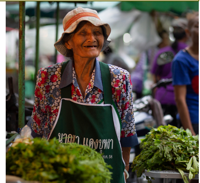
แรงงานนอกระบบจำนวนมากในไทยเริ่มทำงานตั้งแต่อายุยังน้อย และทำต่อเนื่องไปจนอายุเกิน 65 ปี