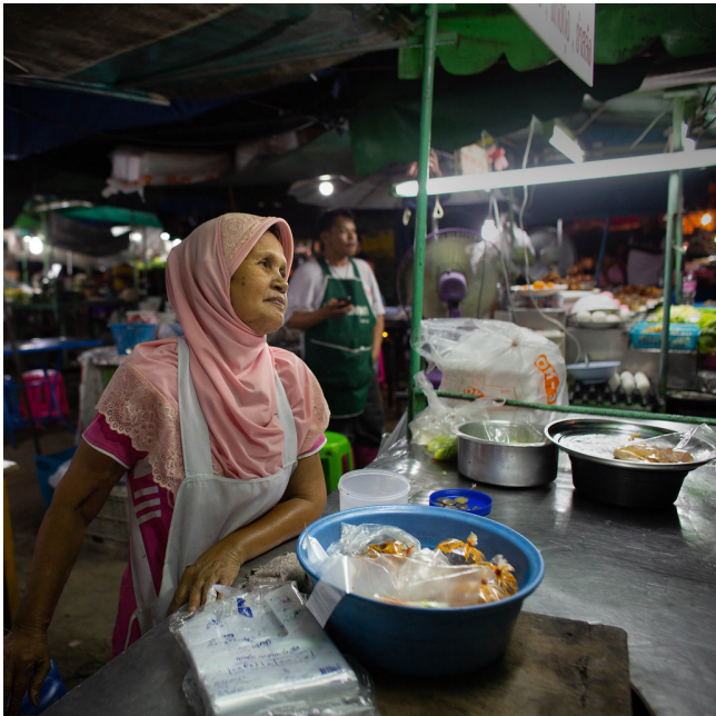
แรงงานนอกระบบเป็นภาคส่วนที่สำคัญของกำลังแรงงานในประเทศไทย