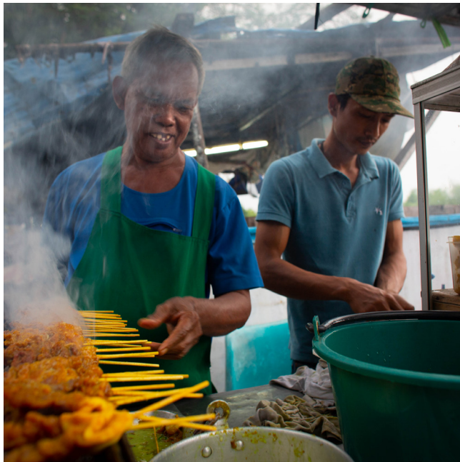
ผู้ค้าหาบเร่แผงลอยเป็นอาชีพที่มีแนวโน้มมากที่สุดที่จะรายงานการบาดเจ็บจากการทำงานในพื้นที่ใจกลางเมืองในประเทศไทย

มีรายงานการบาดเจ็บจากการทำงานจากผู้ค้าหาบเร่แผงลอยในกรุงเทพมหานคร (ร้อยละ 20) และในเขตเมือง (ร้อยละ 15) มากที่สุด แต่ในภาพรวมระดับประเทศผู้ทำการผลิตที่บ้าน (ร้อยละ 13) มีแนวโน้มรายงานการบาดเจ็บจากการทำงานมากกว่าเมื่อเปรียบเทียบกับร้อยละ 12 ของผู้ค้าหาบเร่แผงลอย (ตารางที่ 8) ในงานทุกประเภทและทุกที่ตั้งทางภูมิศาสตร์ มีแนวโน้มรายงานการบาดเจ็บจากการทำงานของผู้ชายมากกว่าผู้หญิง